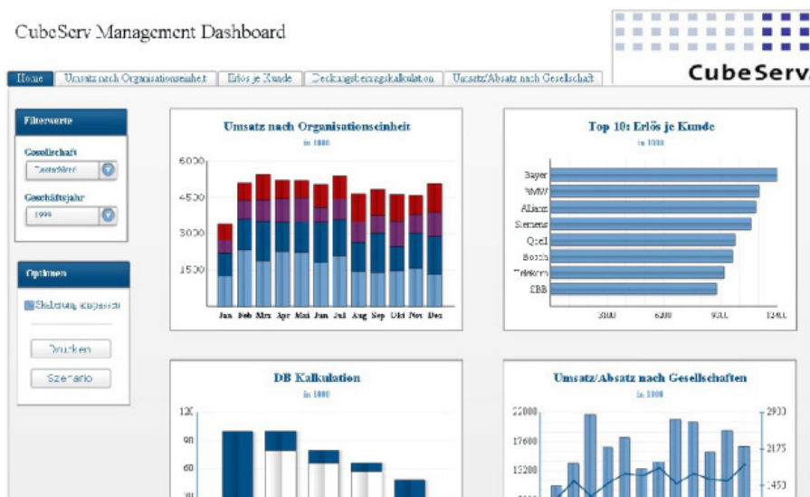
Neue Visualisierungsmöglichkeiten im Bereich Dashboarding mit Crystal Xcelsius

Unsere Berater entwickeln mit Ihnen gemeinsam mögliche Implementierungsszenarien in Form einer Roadmap die für Sie eine wesentliche Entscheidungshilfe im Zuge der weiteren Produktentwicklung von SAP BI darstellen kann.