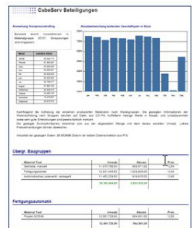
Professionelle Erstellung von Standardreports und Berichtsheets