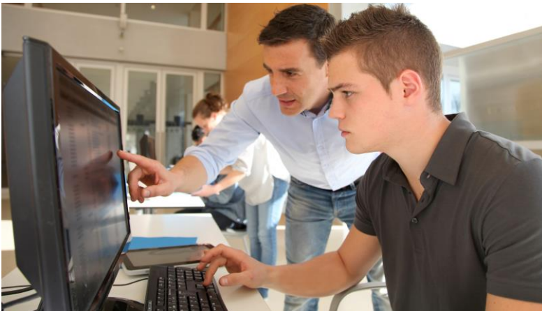
Abbildung: Workshop für die IT – remote oder on-site

Dieser Workshop soll den IT-Verantwortlichen in Ihrem Unternehmen alle relevanten Konzepte und Tools in SAP S/4HANA so vermitteln, dass das Potenzial für ein aussagefähiges Analytics zielgerichtet in der Organisation genutzt werden kann.